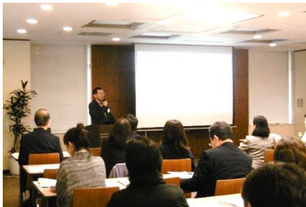
優れた取組を行っているメンバーの事例発表を行い、多面的な展開を考察する機会をつくっています。