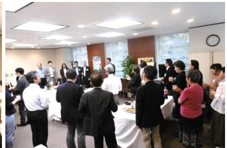
関係者同士の交流を促し、企業や専門家との連携強化を図っています。