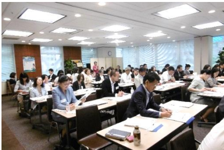
企業・団体・自治体など異業種の関係者が集い、有益な情報交換の場を提供しています。